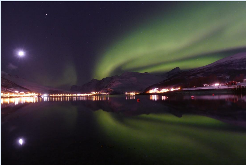
Nordlicht über dem Kaldfjorden

Auf unseren Schneeschuh-Touren sind wir während 4 bis 6 Stunden gemütlicher Gehzeit unterwegs und überwinden dabei 300 bis 850 Höhenmeter. Die Tourenziele passen wir jeweils der Wetter- und Schneesituation an.