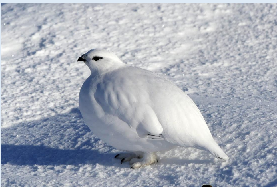
Schneehuhn am Storfjellet