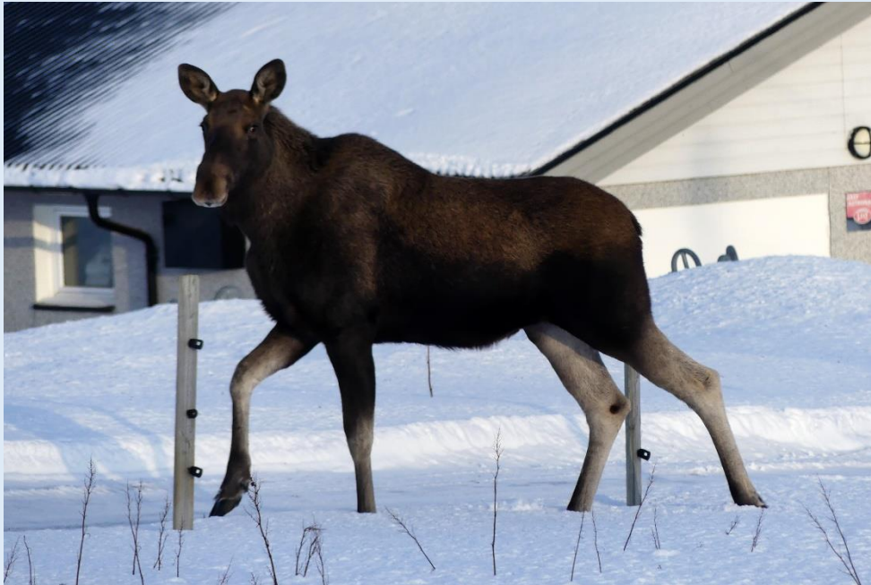
Elch nahe bei der Unterkunft

Für persönliche Beratung stehe ich Ihnen gerne zur Verfügung. Tel. 031 711 01 58 oder bernhard.blaser@nord-zauber.ch