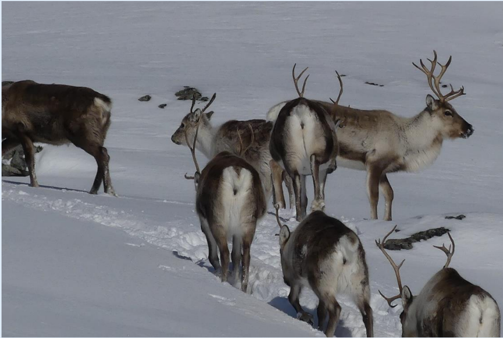
Rentierherde am Rundkollen

Wenn ich bei Ihnen das Interesse für diese Reise geweckt habe, würde es mich riesig freuen, Sie in meiner Gruppe dabei zu haben.